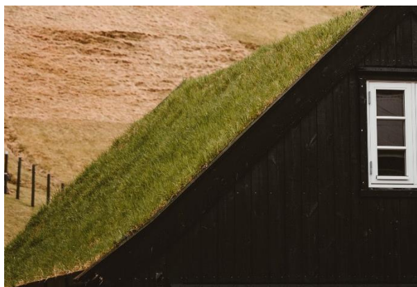
Begrüntes Steildach

Fast alle Dachformen sind zu begrünen – egal ob Flachdach oder Dächer mit bis zu 45°. Ab 10-15° Dachneigung sind entsprechende bauliche Maßnahmen notwendig: Vegetationsmatten, unverrottbare Rutsicherungen, mehrschichtiges Substrat und die fachgerechte Pflege der Dachbegrünung. Grundsätzlich unterscheidet man zwischen extensiv und intensiv begrüntem Dachflächen.